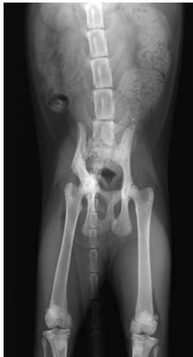
Figura 2: Gato con fractura de pelvis y Megacolon.

El comportamiento en la consulta de Acupuntura desde la primera visita (a los 9 meses de edad) es de agresividad por miedo, difícil manipulación e imposibilidad de insertar agujas.